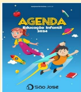
AGENDA ESCOLAR 2024