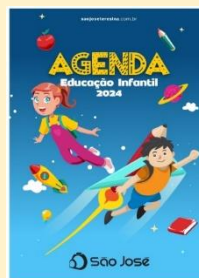
AGENDA ESCOLAR 2024