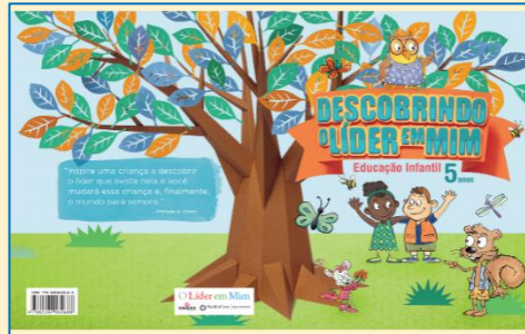
PROGRAMA “LÍDER EM MIM” – NÍVEL II Programa socioemocional (Faz parte do material do Sistema Maxi de Ensino)